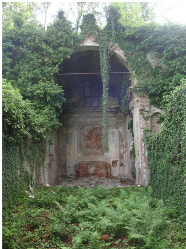
Barengo – oratorio di S. Clemente